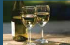
150 ਮਿ.ਲਿ. (1.5 ਔਂਸ) ਵਾਈਨ