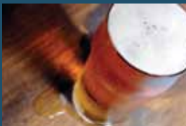
350 ਮਿ.ਲਿ. (12 ਔਂਸ) ਬੀਅਰ