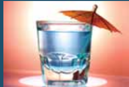
50 ਮਿ.ਲਿ. (1.5 ਔਂਸ) ਕੌਕਟੇਲ